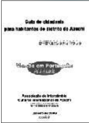
▶ リビングガイドブック